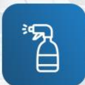
Бытовая химия и косметика