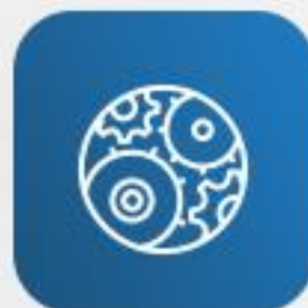
Оборудование и запчасти