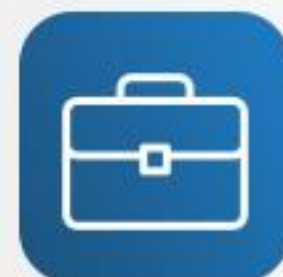
Сумки и кожгалантерея